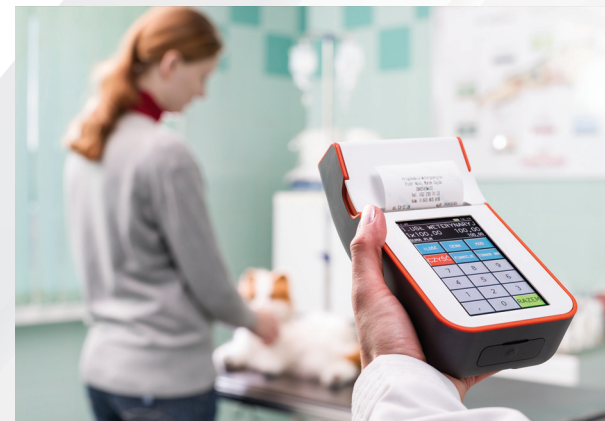
Przychodnia Weterynaryjna, Zbrosławice

Wysoka jakość wykorzystanych materiałów oraz dostępność kilku opcji kolorystycznych obudowy sprawiają, że K10 sprawdza się we wnętrzach klasycznych i nowoczesnych. Przemyślany design dobrze komponuje się z otoczeniem salonu fryzjerskiego, gabinetu lekarza weterynarii czy kancelarii prawnej.