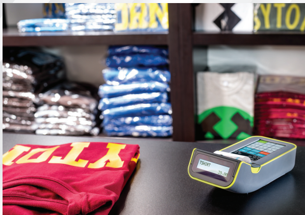
Sklep „Lokalny Patriotą”, Bytom

Wytrzymały akumulator pozwala na wystawienie do 4 200 paragonów, a w razie potrzeby można go łatwo odłączyć i wymienić na inny. Stopień naładowania można kontrolować na pasku stanu kasy. Możliwe jest zasilanie bezpośrednio z instalacji samochodowej 12V.