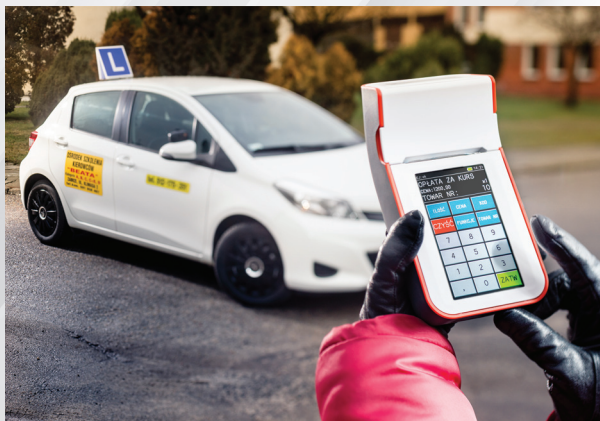
Ośrodek Szkolenia Kierowców "Beata", Zabrze

Rezygnacja z klawiatury mechanicznej pozwoliła na zaoszczędzenie cennego miejsca. Ilość i wielkość wyświetlanych klawiszy zmienia się kontekstowo, a kasę można wygodnie obsługiwać nawet w zimowych rękawicach. Osoby mające wcześniej kontakt z kasami fiskalnymi rozpoczynają pracę na K10 bez używania instrukcji obsługi.